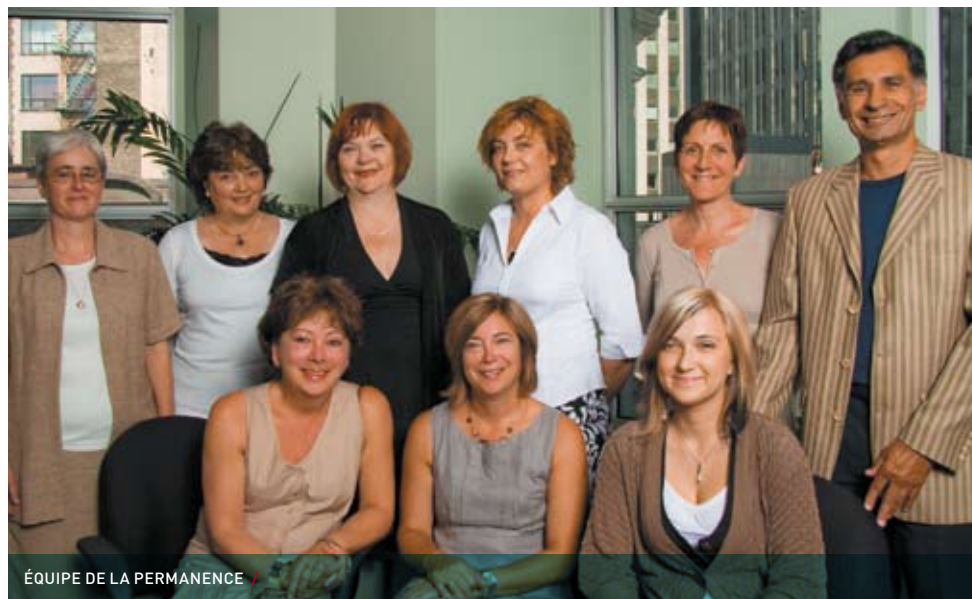
ÉQUIPE DE LA PERMANENCE /